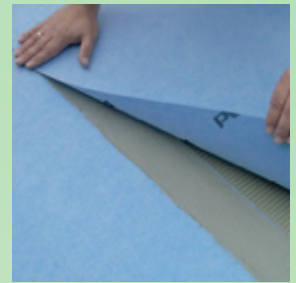
Kiinnitä matto paikoilleen massan avoimena aikana.