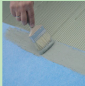
Levitä huolellisesti PCI Seccoral 1K/2K Rapid -liimaa PCI Pecilastic W -maton reunalle tehdäkseen vesitiiviin limisauman.

Pitkät, liikkuvat halkeamat tasoitteessa tai betonissa on sidottava paikoilleen ruiskuttamalla niihin PCI Apogel F -hartsia. Hiushalkeamat eivät vaadi erityiskäsittelyä.