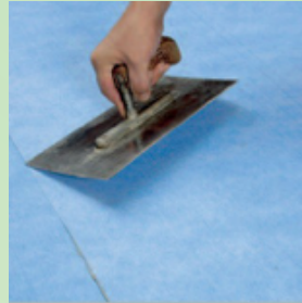
Paina mattoa esim. lastalla tai kumitelalla.